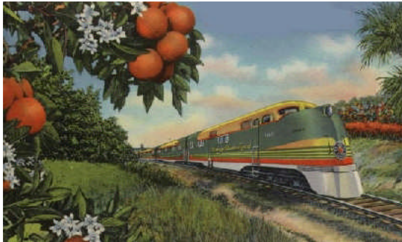
Orange Blossom Special

Ervin et Gordon finirent leurs jours en interprétant leur mélodie célèbre dans les tavernes perdues des Everglades puis s'éteignirent en très peu de temps achevés par l'alcoolisme et la dépression.