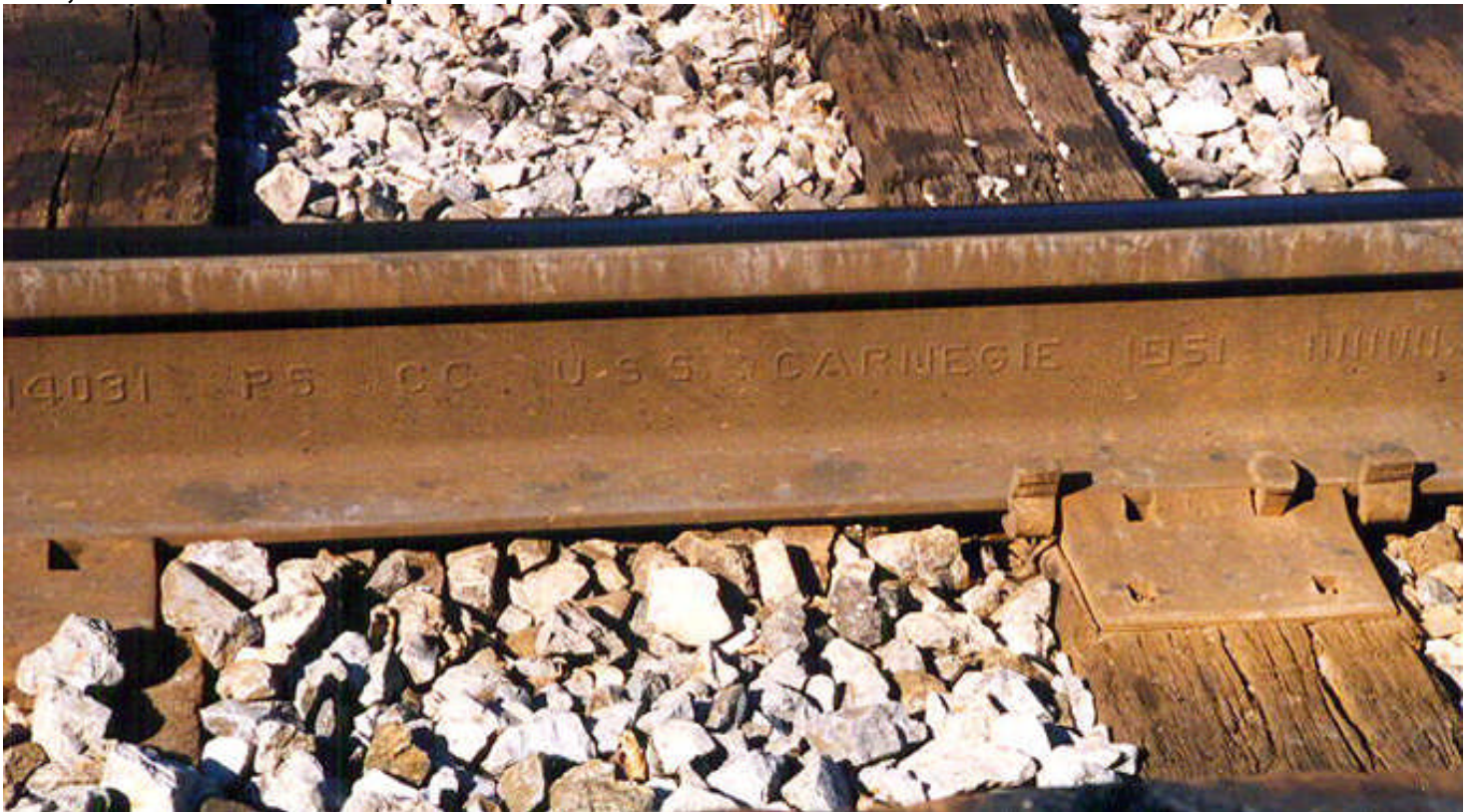
Orange Blossom Special, et son instrument de percussion original.

Bref, l'histoire ne faisait que commencer.