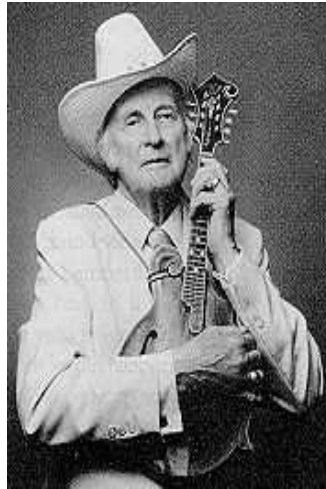
Bill Monroe, surnommé : « Le père du Bluegrass »